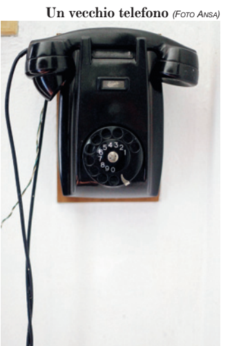
Un vecchio telefono